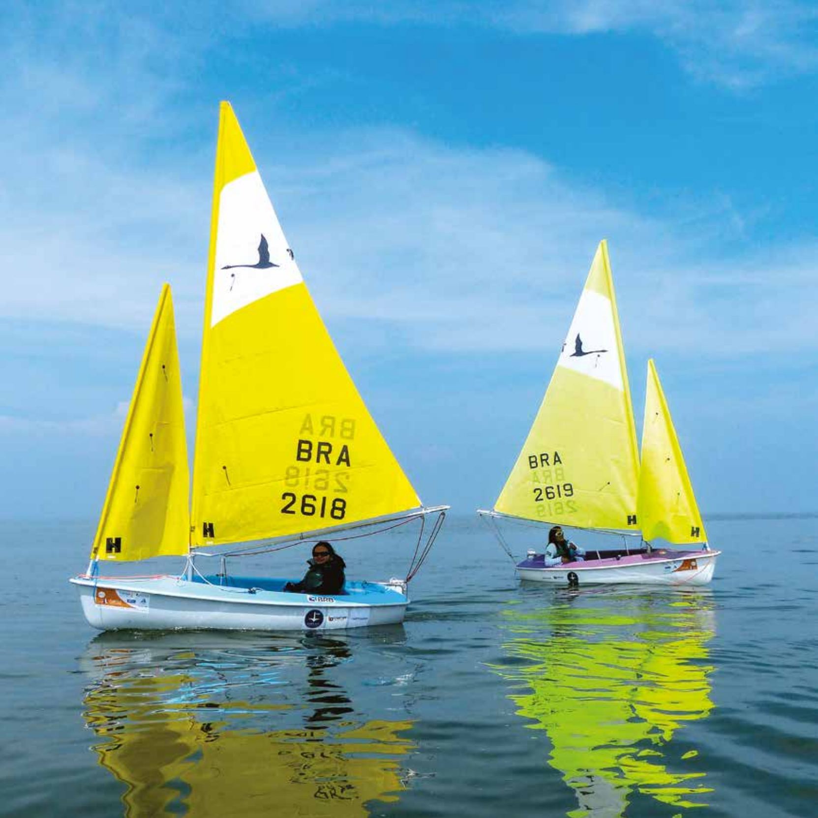
JOSÉ OLÍMPIO / JULIO POHL